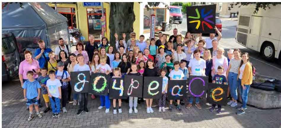
Група з Каменя в Дортмунді-Вікеде

Молода дівчина з Німеччини, яка проводила