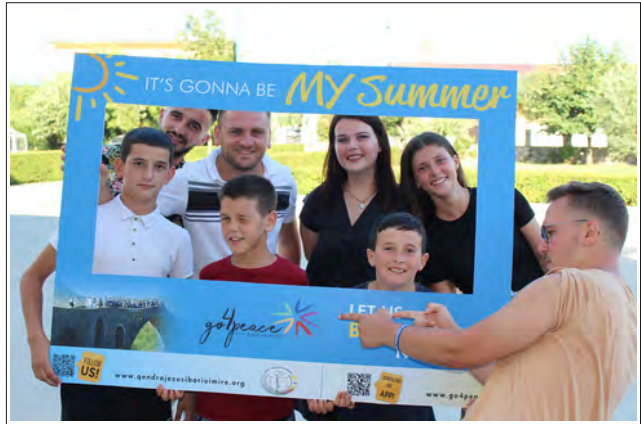
Молодь у Шкодрі / Албанія

Багатьох з них ми зустрічали під час різних благодійних акцій . Ми побачили ,що ці люди талановиті. Деякі чудово малювали, конструювали та шили. Вони погодилися провести майстер-класи в таборі, але ніхто з них не міг уявити, яким він буде . За кілька днів до табору ми організовували зустріч ведучих семінару,використовуючи сервіс